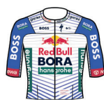
RED BULL - BORA - HANSGRÖHE ROOKIES