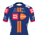
DEVELOPMENT TEAM PICNIC POSTNL