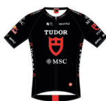
TUDOR PRO CYCLING TEAM