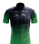
TEAM NOVO NORDISK DEVELOPMENT