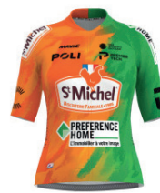
ST MICHEL - PREFERENCE HOME - AUBER 93