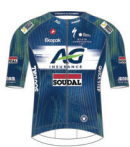
AG INSURANCE - SOUDAL TEAM