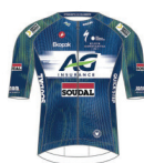
AG INSURANCE SOUDAL DEVO TEAM