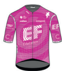
EF EDUCATION - EASYPOST