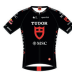
TUDOR PRO CYCLING TEAM U23