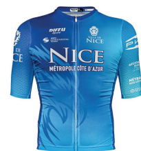
NICE METROPOLE CÔTE D'AZUR