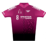
ABUS - SPRINTEUR CLUB FÉMININ