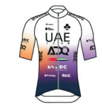
UAE TEAM ADQ