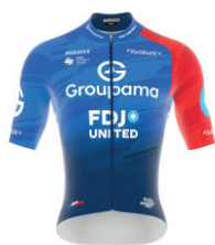
GROUPAMA - FDJ UNITED World Team