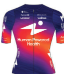
HUMAN POWERED HEALTH