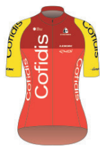
COFIDIS WOMEN TEAM