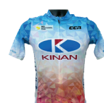
KINAN RACING TEAM