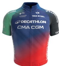
DECATHLON CMA CGM DEVELOPMENT TEAM