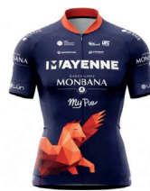
MAYENNE MONBANA MY PIE