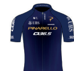
PINARELLO-Q36.5 PRO CYCLING TEAM