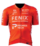
FENIX-PREMIER TECH DEVELOPMENT TEAM