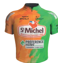
ST-MICHEL - PREFERENCE HOME - AUBER 93