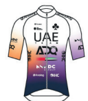
UAE DEVELOPMENT TEAM