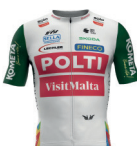
TEAM POLTI VISITMALTA