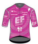
EF EDUCATION - OATLY