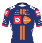
TEAM PICNIC POSTNL