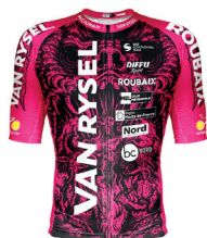
VAN RYSEL ROUBAIX