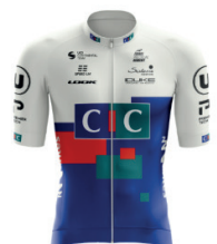
CIC PRO CYCLING ACADEMY