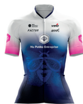
MA PETITE ENTREPRISE