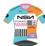
NSN CYCLING TEAM