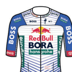
RED BULL - BORA - HANSGRÖE