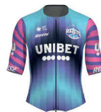
UNIBET ROSE ROCKETS