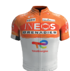
INEOS GRENADIERS RACING ACADEMY