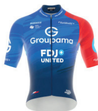
GROUPAMA - FDJ UNITED