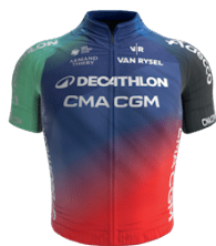
DECATHLON CMA CGM TEAM