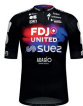
FDJ UNITED - SUEZ