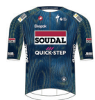
SOUDAL QUICK-STEP DEVO TEAM